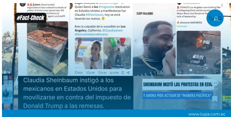
Figura 1. Imagen de presentación del reporte titulado “Protestas en Los Ángeles: datos y desinformación” 11 de junio de 2025

Los aspectos vinculados a sus procesos de producción son imágenes fotográficas reales, insertadas en publicaciones de X desde cuentas anónimas, pero descontextualizadas a las protestas de Los Ángeles en todos los casos. Los cuerpos de texto que acompañan a las publicaciones manejan un tono de redacción alarmista, y emplean hashtags que acusan de narcotraficante a la gobernante mexicana, responsabilizándola de los actos violentos que son calificados de locura absoluta.