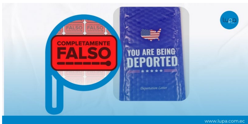
Figura 3. Imagen de presentación del reporte titulado “La carta de deportación falsa para jugar una broma pesada a los migrantes en EE.UU.” tomado del portal web de Lupa Media (Media 2025) 12 de marzo de 2025

En el video viralizado en redes sociales, se observa como un supuesto asesor jurídico de derechos humanos, enseña procedimientos en caso de recibir en sus buzones físicos de domicilio, la notificación de que está siendo deportado.